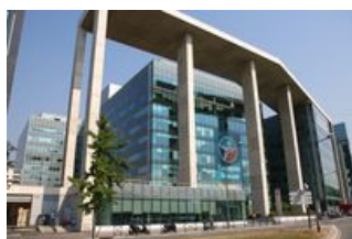
Arcs de Seine